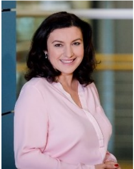
Dorothee Bär, MdB

» Gerne unterstütze ich die Idee, in Hirschaid ein MINT-Zentrum zu errichten und zum ersten TUMO-Lernzentrum in Bayern auszubauen. Kinder und Jugendliche brauchen Bildungsangebote im Bereich MINT und Digitalisierung auch außerhalb der Schule. «