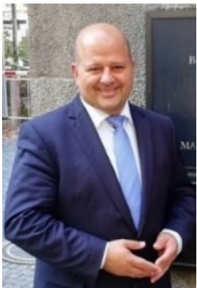
Holger Dremel Landtagsabgeordneter für die Region Bamberg-Land

» Für die Belange der Wirtschaft ist die digitale Bildung eine zentrale Basisqualifikation und Grundlage eines nachhaltigen wirtschaftlichen Erfolgs. Gerade dafür sind die angestrebten Selbstlernaktivitäten und Workshops ein besonders passendes Bildungskonzept. Aus Überzeugung unterstütze ich deshalb die Idee, in Hirschaid ein MINT-Zentrum zu errichten und zum TUMO-Lernzentrum auszubauen. «