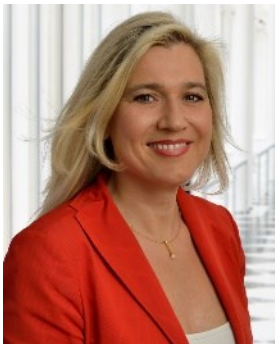
Staatsministerin Melanie Huml, MdL

» Innovation ist der Schlüssel zu nachhaltigem Erfolg. Damit Bayern auch in Zukunft in der Spitzenliga spielt, sollten wir Kinder und Jugendliche frühzeitig für Forschung und Praxis begeistern, speziell im MINT-Bereich. Deshalb unterstütze ich die Pläne für ein außerschulisches Lernzentrum in Hirschaid. «